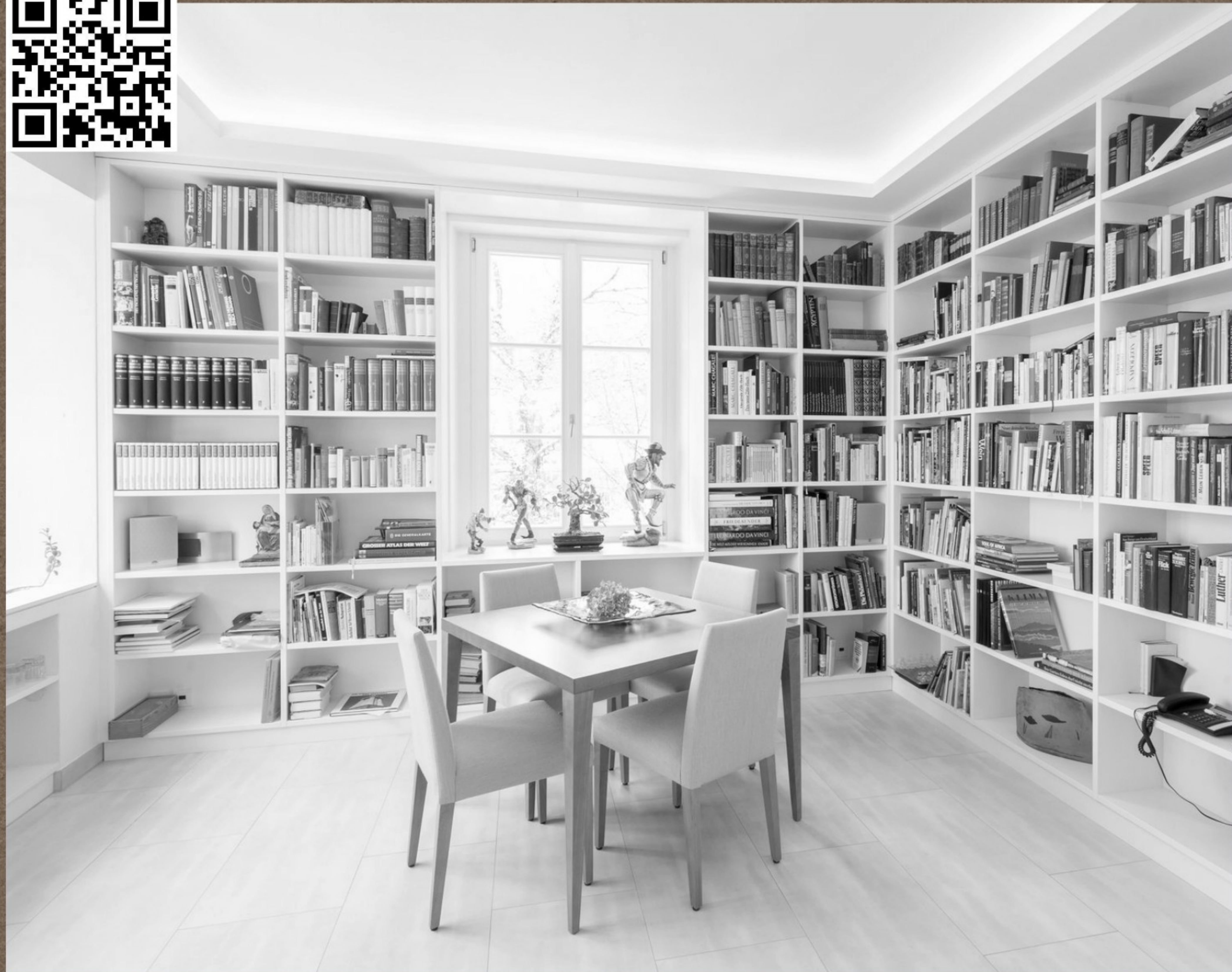
alle Projekte von MTB